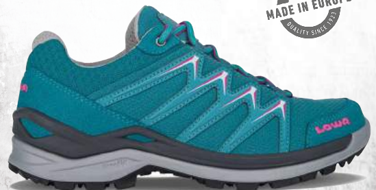
INNOX PRO GTX LO Ws | All Terrain Sport