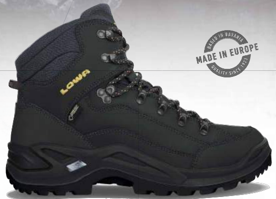
RENEGADE GTX MID | All Terrain Classic